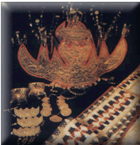
Kain Tapis umumnya dibuat oleh wanita, kain tapis digunakan dalam upacara-upacara tradisional, menyambut tamu agung, upacara pernikahan adat, dan even tradisional lainnya.